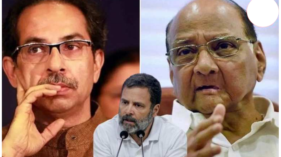
(યુબીટી)એ મુંબઈ ની ૩૬માંથી ૨૧ વિધાનસભા બેઠકો પર ચૂંટણી લડવાની તૈયારીઓ શરૂ કરી દીધી છે. શરદ પવાર સાત બેઠકો ઈચ્છે છે. આવી સ્થિતિમાં કોંગ્રેસ માટે માત્ર આઠ બેઠકો બચી

લોકસભાની જેમ વિધાનસભામાં પણ ચમત્કાર કરવાની યોજના બનાવી છે. દરમિયાન તાજેતરમાં એક પ્રેસ કોન્ફરન્સમાં સંજય રાઉતે દાવો કર્યો હતો કે મુંબઈમાં મહાવિકાસ અઘાડી મજબૂત સ્થિતિમાં છે. તેમણે કહ્યું કે મુંબઈમાં મહાવિકાસ અઘાડીમાં ૧૨૫ બેઠકો પર સહમતી સધાઈ છે અને બાકીની બેઠકો માટે વાતચીત ચાલી રહી છે. મહારાષ્ટ્રમાં કોંગ્રેસ, ઉદ્ભવ ઠાકરે જૂથ, મહાવિકાસ આઘાડીમાં શરદ પવાર જૂથ